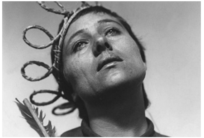
Renée Falconetti dans le rôle de Jeanne d'Arc dans La passion de Jeanne d'Arc de Carl Dreyer (film muet de 1927). On trouve une reproduction de cette image dans la scénographie du spectacle, au-dessus de la console lumière

Cette image de Jeanne d'Arc s'accorde avec l'imagerie traditionnelle qui est apparue, on le voit, peu après l'époque de l'épopée historique. La Jeanne d'Arc qu'on voit ici est à cheval, en armure, et porte un étendard : c'est la figure militaire de Jeanne d'Arc qui est ici mise en valeur, celle qui a réussi à entraîner une armée d'hommes derrière elle. Toutefois elle n'est pas guerrière : en effet, elle ne porte pas d'épée et son étendard est moins une enseigne militaire que le symbole de l'aide de Dieu, dont le nom figure d'ailleurs sur l'étendard. L'armure dessinée ici est assez féminine, fine à la taille et assortie d'un casque-coiffe seyant. Toutefois, le corps et les cheveux de Jeanne sont entièrement dissimulés par ces accessoires qui réduisent son identité à celle de la combattante.