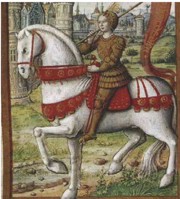
Jeanne d'Arc à cheval, représentation du Moyen-Âge. Enluminure du manuscrit d'Antoine Dufour, Les vies des femmes célèbres , Nantes, musée Dobrée, 1504.